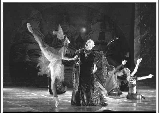
Lindsey Kemp in scena ne "L'uccello di fuoco"