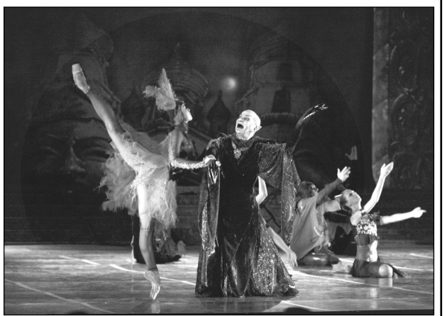
Lindsey Kemp in scena ne "L'uccello di fuoco"