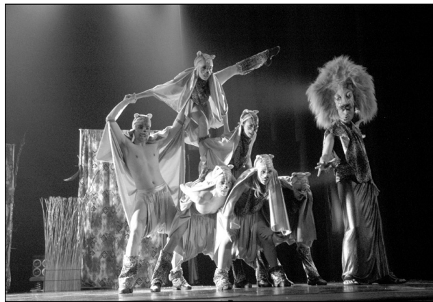
Un momento de "La fabbrica dei sogni"

Una serata di risate e allegria, per la Giornata della donna. A organizzarla, questa domenica 7 marzo, presso l'oratorio della Bicocca, il CdQ Sud est. In scena l'accademia nazionale del comico, in "Cabaret". Ingresso gratuito. Al termine omaggio floreale al pubblico femminile.