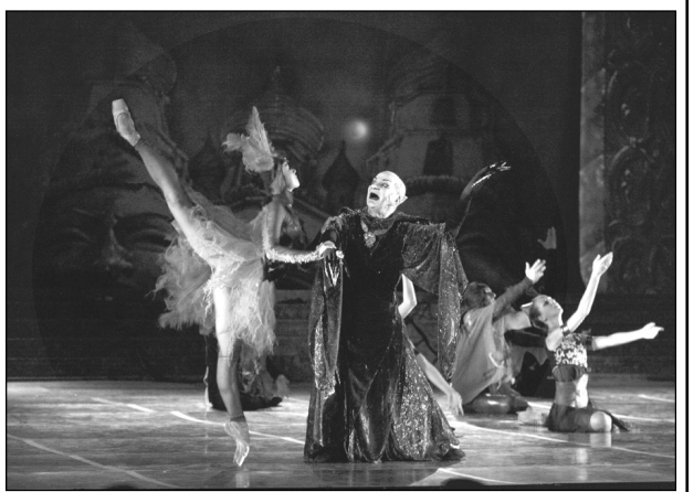
Lindsey Kemp in scena ne "L'uccello di fuoco"