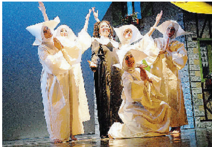
Una scena dello spettacolo «All that» dedicato ai musical

«A chorus line» è stato superato solo da «Cats», che ha battuto i record di longevità, spettatori e incassi. Ma non se la cavano male neanche «Grease», con un milione e 300 mila spettatori in Italia a dieci anni dal debutto, e «Jesus Christ Superstar», apprezzato anche in versione italiana. Sono alcuni dei musical dello show «All that», in scena questa sera alle 21 nel salone del bocciodromo di Brusson. In un susseguirsi di brani celebri si alterneranno inoltre